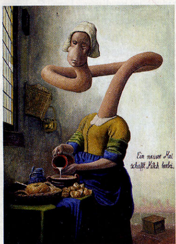
Ein nasser Mai schafft Milch herbei.

L angweiliger als die Tatsache, dass es jedes Jahr immer um dieselbe Zeit ein angeblich neues Jahr gibt, dass sich dann sehr rasch (spätestens nach Ostern) auch wieder nur als ein altes erweist... Langweiliger als die Tatsache, dass die Jahre immer die nächstfolgende Nummer bekommen, so dass man praktisch schon viele Monate vorher weiß, welche Nummer das nächste Jahr haben wird... Langweiliger als diese Langeweile sind nur die Kalender zum neuen Jahr. Besonders die lustigen. Aber auch der »Baywatch«-Kalender mit Pamela Anderson.